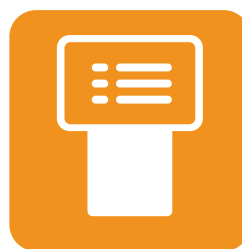
Detecta tiempo promedio