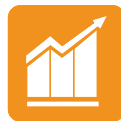
Informes en tiempo real