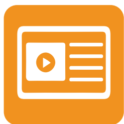
Visualizador en pantalla

En este módulo puedes ingresar a los pacientes que van a realizarse procedimientos dentro de tu IPS con las siguientes opciones: